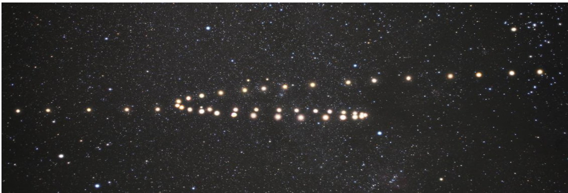
Imagem 1. Se você é do hemisfério sul, veria o movimento com o norte para baixo