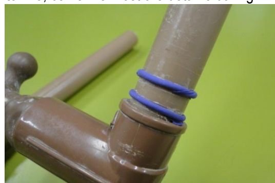
Figura 12. Detalhe dos bicos de balões de aniversário nos sulcos do tubo de lançamento.