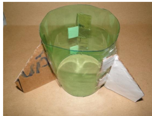
Figura 6 A saia com as aletas