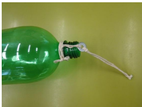
Figura 7. Detalhe da arruela presa no bocal do foguete e o rabicho