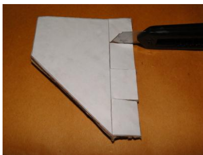
Figura 3. Detalhe do corte da aleta