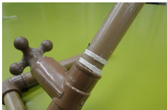
Figura 11. Detalhe da sugestão para evitar vazamento.

Outra opção é substituir as voltas de barbante por dois bicos de balões de aniversário e sobre estes colocar uma camada de fita isolante. Veja detalhe na Fig. 12. O tubo de lançamento deve ser colocado inclinado de 45^\circ . Corte um quadrado de papelão de 20 x 20 cm e em seguida corte-o na diagonal. Use uma das partes como um esquadro para colocar o tubo em 45^\circ .