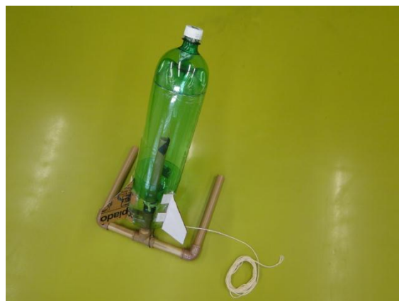
Figura 14. Foguete preparado para o lançamento (na foto está sem o combustível)

Escolha um local de terra não muito dura. Tenha em mãos um martelo e dois grampos de metal (pode-se fazer dobrando em U dois aros de bicicletas ou hastes similares). Escolha cuidadosamente a direção de lançamento. NUNCA lance o foguete na vertical. Vire, finalmente, o foguete para cima. Observe que o balão estoura. Se isso não ocorrer vire o foguete para baixo e para cima até que o balão estoure. Quando isso ocorrer apoie a base no chão. Não fique na frente do foguete. Finque muito bem os dois grampos por sobre os canos de 20 cm de comprimento. Confira que o barbante do gatilho esteja bem preso na extremidade superior do gancho metálico. Estique o barbante completamente na direção perpendicular ao foguete. Se houver algum pequeno vazamento, se apresse em fazer o lançamento, mas NÃO SE PRECIPITE . É melhor fazer um lançamento de pequeno alcance do que perder todo o combustível, ou o que é pior, lançando na direção errada e machucando alguém ou danificando algum bem móvel ou imóvel. Veja Fig. 14.