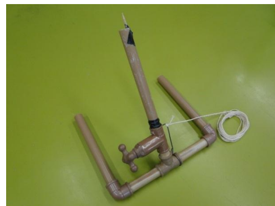
Figura 9. A base de lançamento montada.