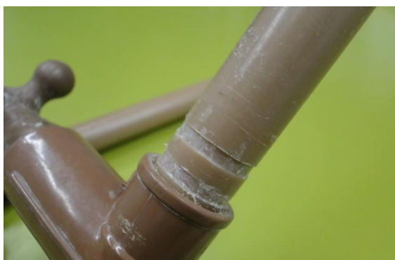
Figura 10. Detalhe dos finos e estreitos sulcos feitos no tubo de lançamento.

No centro da base, inclinado de 45^\circ , está o tubo de lançamento, pois ele fica dentro do foguete. Contudo, o diâmetro do tubo é ligeiramente menor do que o diâmetro interno do bocal do foguete. Este vai estar com o combustível (vinagre) sob alta pressão e não poderá haver vazamento do líquido.