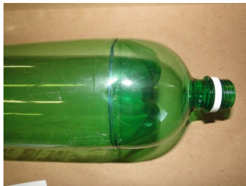
Figura 5. O bico fixado no foguete.

Para prender o foguete à sua base vamos usar uma arruela amarrada no “pescoço” do bocal (=local por onde sai o conteúdo da garrafa), ou seja, no bico da garrafa (não no bico recortado). Veja a Fig. 7. O “rabicho” do barbante será útil no momento de encaixar o gancho da base na arruela.