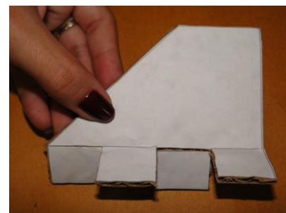
Figura 4. Aleta pronta para ser fixada

O bico e a saia do foguete. Encaixe o bico do foguete (Fig. 1) e fixe-o, com fita adesiva no fundo de outra garrafa do mesmo tipo. Veja Fig. 5. Da mesma garrafa de onde recortou o bico, recorte do corpo dela, uma faixa com cerca de 12 cm de altura. Fixe nesta faixa as três aletas dispostas a 120^\circ na parte inferior dela, a qual vamos chamar agora de “saia”, como mostra a Fig. 6.