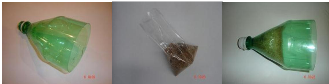
Figura 1 Bico e contra peso do foguete

O bico do foguete. Corte uma garrafa de refrigerante a aproximadamente, 15 cm do gargalo. Coloque, aproximadamente, 200 g de areia num saco plástico e passe-o pelo interior do bico da garrafa até fixar o saco na parte superior do bico através do fechamento da tampa sobre o excesso de plástico do saco, conforme mostra a Fig. 1.