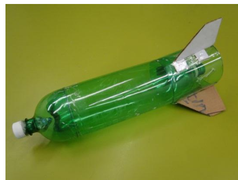
Figura 8. O foguete já montado com bico e saia.