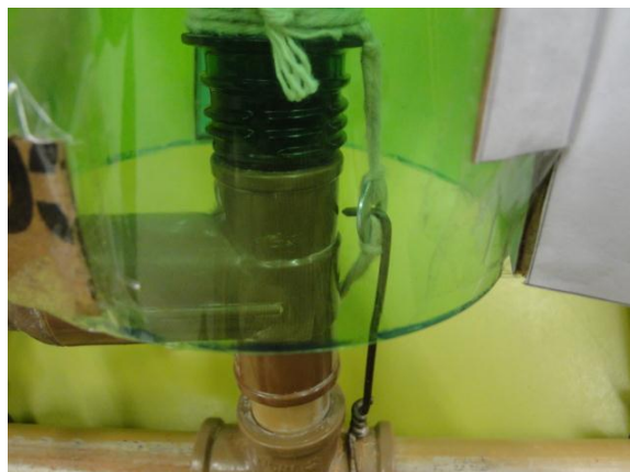
Figura 13. Detalhe de fixação do gancho na arruela e do barbante (gatilho).

tempo, prenda o gancho de arame da base à arruela (brinco) que está presa no pescoço do foguete. Não vire o foguete para cima. Mantenha-o para baixo! Não fure o balão!!! Fique atento! Certifique-se que o gancho esteja bem preso na arruela e que o barbante (o gatilho, não o rabicho) esteja bem fixado na extremidade superior do gancho. Cuide para que seu polegar direito mantenha o gancho dentro da arruela. Se a extremidade da saia ficar abaixo da arruela faça um corte longitudinal na saia para que o gatilho passe por este corte e não toque na saia quando for puxado. Veja o detalhe na Fig. 13.