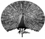
Tabela e Figura para o Exercício 7